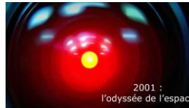
2001 : l'odyssée de l'espace